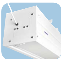
Makkelijk te heffen door vlakke onderkant.