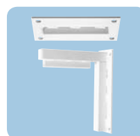
Montage aan wand en plafond