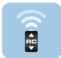
Standaard met afstandsbediening