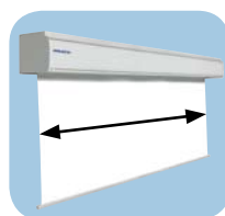
Leverbaar van 7 tot 10 meter breed