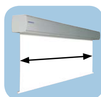
Leverbaar van 5 tot 7 meter breed